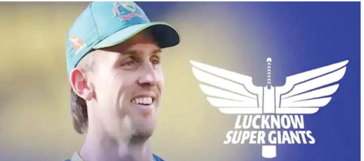
కేవలం బ్యాట్స్ మెన్ గా లక్నో తరఫున బలం కి..!

ముంబై: ఐపీఎల్-2025 సీజన్ లో ఆడేందుకు ఆస్ట్రేలియా ఆల్ రౌండర్ మిచెల్ మార్ష్ అనుమతి లభించింది. అయితే, కేవలం బ్యాట్స్ మెన్ గా మాత్రమే ఆడనున్నారు. ఈ సీజన్ లో మిచెల్ మార్ష్ లక్నో సూపర్ జెయింట్స్ తరఫున బలోకి దిగనున్నారు. ఇప్పటి వరకు ఐపీఎల్ లో ఆడుతాడా? లేదా? అన్నది అనుమానాస్పదంగా ఉండగా.. నిపుణులతో చర్చించిన తర్వాత లక్నో జట్టు తరఫున ఆడేందుకు గ్రీన్ సిగ్నల్ లభించినట్లుగా ఓ నివేదిక సేకార్యం. రీపబ్లికేషన్, వైస్ పర్సెక్టర్ల అనుమతి వచ్చింది. అతను బొలింగ్ చేయద్దను.. ఫీల్డింగ్ చేస్తున్న సమయంలో వీపుపై ఎక్కువగా