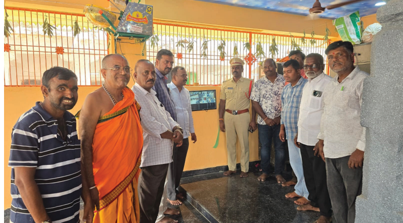
చౌరస్తాలో ఏర్పాటు చేసిన నేరాలను నియంత్రించవచ్చన్నారు. సీసీ కెమెరాల నిఘాతో అన్ని విధాలుగా భద్రత లభిస్తుందన్నారు. ఒక్క సీసీ కెమెరా