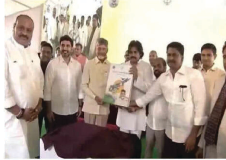
పెరగాలన్నది లక్ష్యం. విజన్ డాక్యుమెంట్ కోసం 17 లక్షల మంది తమ ఆలోచనలు పంచుకున్నారు. సంస్కరణల ద్వారానే ప్రజల జీవితాల్లో మార్పులు తీసుకురావాలంటే.

నూత్రాలు.. ఒక విజన్' పేరిట డాక్యుమెంట్ ను సీఎం చంద్రబాబు ఆవిష్కరించారు. జాతికి, రాష్ట్ర ప్రజలకు ఇది అంకితమని రాసి నంతకం చేశారు. అనంతరం పవన్ కల్యాణ్, మంత్రి లోకేశ్ తో పాటు పలువురు ఎమ్మెల్యేలు, అధికారులు సంతకాలు చేశారు. స్వర్ణాంధ్ర విజన్ 2047.. రాష్ట్ర దశ, దిశను మారుస్తుందని సీఎం చంద్రబాబు అన్నారు. ఈ సం దర్భంగా ఏర్పాటు చేసిన కార్యక్రమంలో ఆయన మాట్లాడారు. డాక్యుమెంట్ ఆవిష్కరణ సరికొత్త చరిత్రకు నాంది అన్నారు. వైసీపీ హయాంలో ఊహించిన దానికంటే ఎక్కువ విధ్వంసం జరిగిందని చెప్పారు. పరిపాలన ప్రారంభించిన 6 నెలల్లోనే విజన్ డాక్యు మెంట్ రూపొందించామన్నారు. తెలుగుజాతి ప్ర పంచంలోనే సంవత్సరం 1గా నిలవాలనే సంకల్పంతో ముందుకెళ్తున్నాం. దేశంలోనే ఏపీ అగ్రగామిగా నిలవాలనే సంకల్పంతో ఉన్నాం. నేడు 3 వేల దాల్చడ కంటే తక్కువగా తలసరి ఆదాయం ఉంది. 2047 నాటికి 42 వేల దాల్చడ తలసరి ఆదాయం