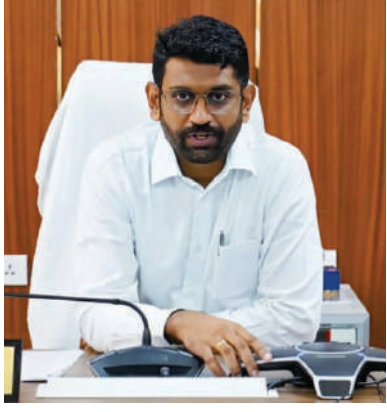
ఫోటోను అతికించాలన్నారు. డాన్లోడ్ చేసిన హాల్ టికెట్ పై ఫోటో సరిగా ముద్రించి లేకుంటే, అభ్యర్థి గెజిటెడ్