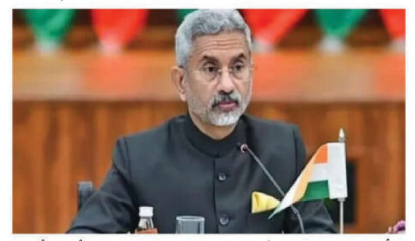
అరెస్టుతో బంగ్లాలో పరిస్థితి మరింత దిగజారింది. ఆయనకు న్యాయాయం అందించడంపై ఆందోళనలు నెలకొన్నాయి. ఈ నేపథ్యంలో బంగ్లాదేశ్ ఇద్దరు దౌత్యవేత్తలను వెనక్కి పిలిపించింది. తదుపరి ఆదేశాలు వచ్చేవరకు వారిద్దరూ ఢాకా నుంచి పని చేయాలని సూచించినట్లు సమాచారం. దీంతో ఇరు దేశాల మధ్య ఉద్రిక్తతలు మరింత పెరిగినట్లుంది. షేక్ భారత్ పాకేత్ చర్చలకు ముందడుగు వేస్తుందని పేర్కొన్నారు. ఇస్మాయిల్ చెందిన చిన్నయే కృష్ణదాస్

నేషనల్ బ్యూరో: బంగ్లా దేశ్ లో మైనారిటీలు, హిందువులపై దాడులు జరుగుతున్నాయని లోక్ సభలో భారత విదేశాంగ శాఖ మంత్రి జై శంకర్ అన్నారు. వీటిని నివారించడానికి ఆ దేశ శాశ్వత ప్రభుత్వం మైనారిటీలు, హిందువుల భద్రతకు తగిన చర్యలు తీసుకుంటుందని ఆశిస్తున్నట్లు వెల్లడించారు. ఇటీవల భారత విదేశాంగ శాఖ కార్యదర్శి విక్రమ్ మిశ్రా బంగ్లాదేశ్ కు వెళ్లి అక్కడి నేతలతో చర్చలు జరిపారన్నారు. మరోవైపు పాకిస్తాన్, భారత్ కు మధ్య సత్సంబంధాలు నెలకొనాలంటే ఆ దేశంలో ఉగ్రవాదం పూర్తిగా నశించిపోవాలి.. అప్పుడే భారత్ పాకేత్ చర్చలకు ముందడుగు వేస్తుందని పేర్కొన్నారు. ఇస్మాయిల్ చెందిన చిన్నయే కృష్ణదాస్