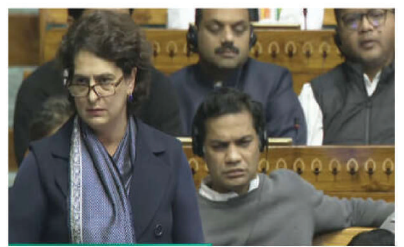
ప్రజా హక్కులు, ప్రభుత్వానికి వ్యతిరేకంగా గతమే శక్తిని రాజ్యాంగం మనకు కల్పించింది. ఇది దేశ ప్రజలను కాపాడే 'సర్కూ కవచం' లా ఉంది. అయితే దీన్ని బద్ధలుకొట్టేందుకు అధికార ఎన్టీ ప్రభుత్వం ఎన్నో ప్రయత్నాలు చేసింది. గత పదేళ్లలో ఈ రక్షణకవచాన్ని బలహీనం చేసింది. లేట్ లో ఎంటి, ప్రైవేటీకరణ వంటి చర్యలతో రిజర్వేషన్లను బలహీనం చేస్తున్నారని ఆరోపించారు.

నేషనల్ బ్యూరో: భారత రాజ్యాంగాన్ని ఆమోదించుకొని 75వ ఏడాదిలోకి అడుగు పెట్టిన సందర్భంగా లోక్ సభలో ప్రత్యేక చర్చ ఏపీ ప్రియాంక గాంధీ ప్రసంగించారు. విపక్షాల తరఫున చర్చను ఆమె ప్రారంభించారు. అధికార బీజేపీ, ఆరెస్సెస్ పై విమర్శలు చేశారు. రాజ్యాంగం అంటే సంఘ్ (ఆరెండ్ స్టెన్స్ ను ఉద్దేశిస్తూ) బుక్ కాదన్నారు. బీజేపీ ఎప్పుడూ గతం గురించే మాట్లాడుతుందని దేశ ప్రగతి కోసం ఇప్పుడేం చేస్తున్నారో చెప్పాలని కోరారు. దేశంలో జరిగే అన్నిటికీ నెహ్రూనే కారణమా? నెహ్రూ పేరును, ఆయన ప్రసంగాలను మీరు వ్యవసాయం చేసుకోవాలి