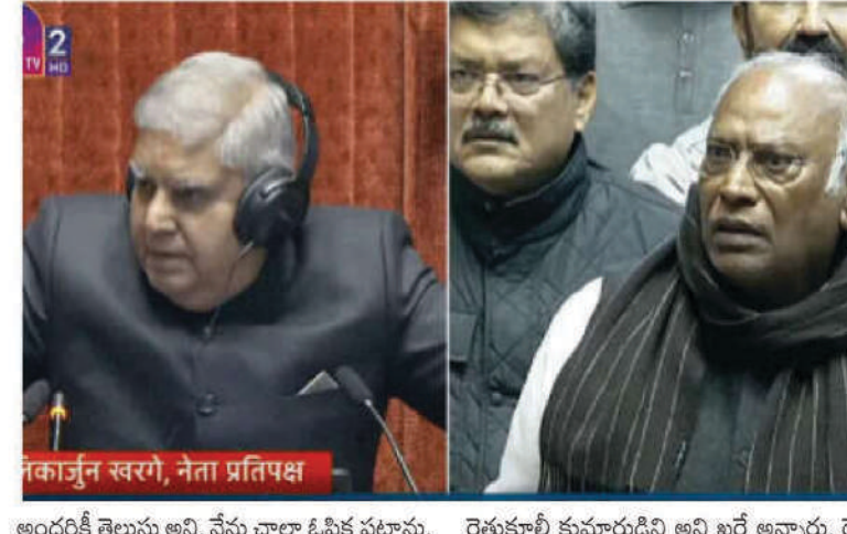
అందరికీ తెలుసు అని, నేను చాలా ఓపిక పట్టాను. రైతు కానీ నేటి రైతు కేవలం పంటపొలాలకే పరిమితం కానీ నేను ఓ కూలీ బిడ్డను అని మీకు చెబుతున్నారని, ఒకవేళ మోషన్ మూవ్ చేస్తే అది 14 రోజులు పడుతుందన్నారు. మీరు టైం తీసుకుని వచ్చి చర్చించండి. లేదంటే నేనే మీవద్దకు వచ్చి చర్చిస్తానన్నారు. దీంతో మీరు రైతు బిడ్డ అయితే.. నేను ఓ

తెలంగాణ బ్యారో: రాజ్యసభలో చైర్మన్ జగదీప్ ధన్ ఖద్, ప్రతిపక్ష నేత మల్లికార్జున్ ఖర్ మధ్య మాటల యుద్ధం కొనసాగింది. ఆదివాసం తీర్మానంపై చర్చ చేపట్టాలని విపక్షాలు డిమాండ్ చేశాయి. వాయిదా వేసినా సరే కరించాలని విపక్షాలు కోరాయి. ఆ సమయంలో చైర్మన్ ఉన్న ధన్ ఖద్ మాట్లాడుతూ.. గడిచిన 30 ఏళ్లలో ఎన్ని సార్లు రూల్ 267 వాడారో తనకు తెలుసు అన్నారు. మీ విజ్ఞతలే ఈ విషయాన్ని వదిలి వేస్తున్నట్లు చెప్పారు. రికార్డు స్థాయిలో రూల్ 267 కింద వాయిదా తీర్మానాలను ఇప్పటివల్ల ధన్ ఖద్ పేర్కొన్నారు. విపక్షాలు పట్టుపట్టడంతో.. చైర్మన్ ధన్ ఖద్ సీరియస్ అయ్యారు. నేను రైతు బిడ్డను, నేను ఎలాంటి బలవంతుడు ప్రదర్శించబోనని ధన్ ఖద్ తెలిపారు. ఈ దేశం కోసం ప్రాణాలిస్తాను. ఓ రైతు బిడ్డ ఈ స్థానంలో కూర్చున్నారన్న విషయాన్ని డిగ్రీలు చూడకపోతున్నారన్నారు. మీ వెకిలి చిచ్చలు