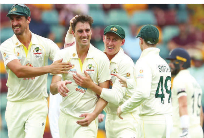
ఎంపిక చేసింది. దురదృష్టవశాత్తు అతను గత 18 నెలల్లో వెంచెనె ఎక్కువ సమయం గడిపాడని పేర్కొన్నారు. తుదిజట్టులో స్థానం దొంగిలించువల్ల రాజీనామా చేశాడు.

ట్రెస్సెన్: ఐదు టెస్ట్ మ్యాచుల సిరీస్లో భాగంగా భారత ఆస్ట్రేలియా మధ్య శనివారం మూడో టెస్ట్ జరుగుతుంది. ట్రెస్సెన్లోని గబ్బా వేదికగా జరిగే మూడో కోసం క్రికెట్ ఆస్ట్రేలియా జట్టును ప్రకటించింది. రెండు టెస్టుకు గాయం కారణంగా దూరమైన జోష్ హేజిల్వుడ్ మళ్లీ తిరిగి జట్టులోకి వచ్చాడు. హేజిల్వుడ్ను జట్టులోకి తీసుకోవడంతో స్కాట్ బోలాండ్ను పక్కన పెట్టింది. అదీలైట్ డే-నైట్ టెస్టులో హేజిల్వుడ్ స్థానంలో బోలాండ్ కుదిరి జట్టులో స్థానం కల్పించిన విషయం తెలిసింది. కెప్టెన్ పాల్ కమిన్స్ మాట్లాడుతూ బోలాండ్ అదీలైట్లో అద్భుత ప్రదర్శన చేశాడని గుర్తు చేశారు. గబ్బా టెస్టుకు ఉస్మాన్ ఖాన్, నాథన్ మెకెన్సీ, మార్కస్ లాబుషెగ్నో, స్టీవ్ స్మిత్, ట్రావిస్ హెడ్, మిచెల్ మార్ష్, అలెక్సీ కార్ (వికెట్ కీపర్), పాల్ కమిన్స్ (కెప్టెన్), మిచెల్ స్టార్క్, నాథన్ లియాన్, జోష్ హేజిల్వుడ్ను క్రికెట్ ఆస్ట్రేలియా