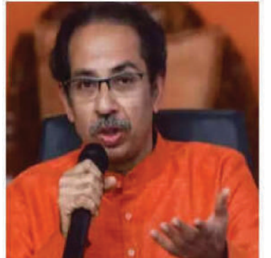
హింసను మాత్రం ఆపలేరా అని ఎద్దేవా చేశారు. ప్రధాని మోడీ తరచూ విదేశీ పర్యటనలకు వెళ్తుండడం వల్ల ఆయనకు మణిపూర్ అల్లర్లు, బంగ్లాదేశ్ లో జరుగుతున్న హింస గురించి తెలిసి ఉండకపోవచ్చని అన్నారు. బంగ్లా మాజీ ప్రధాని షేక్ హసీనా భారత్ లో సరక్తికంగా ఉన్నారు.. మరి ఆ దేశంలో కష్టాలు పడుతున్న హిందువుల సంగతి ఏంటి? అని ప్రధానిని ప్రశ్నించారు.