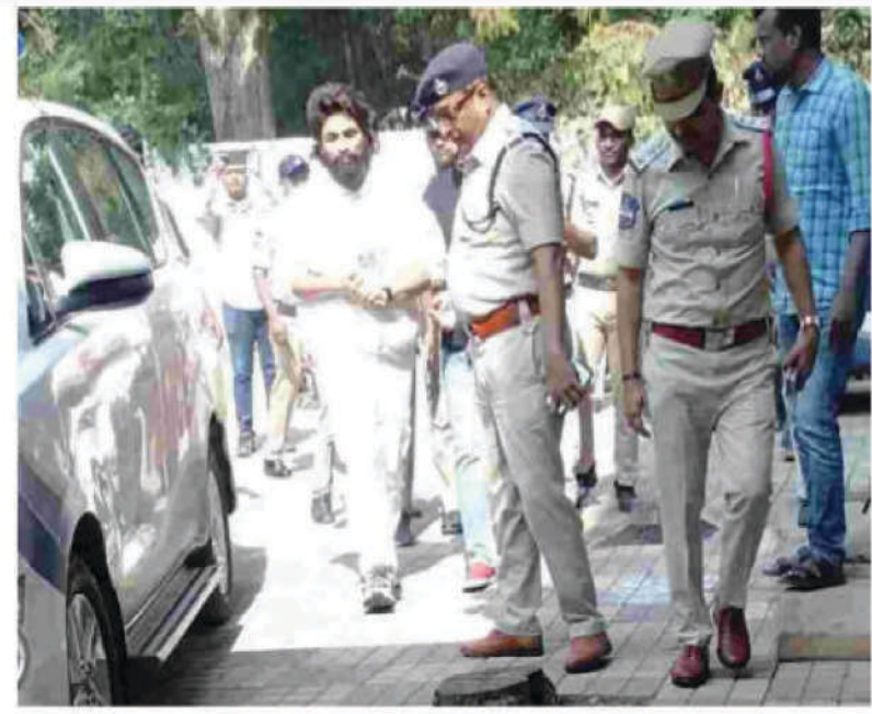
పోలీసులు అరెస్ట్ చేసిన అల్లు అర్జున్ ను చిక్కడపల్లి పోలీస్ స్టేషన్ కు తరలింపు