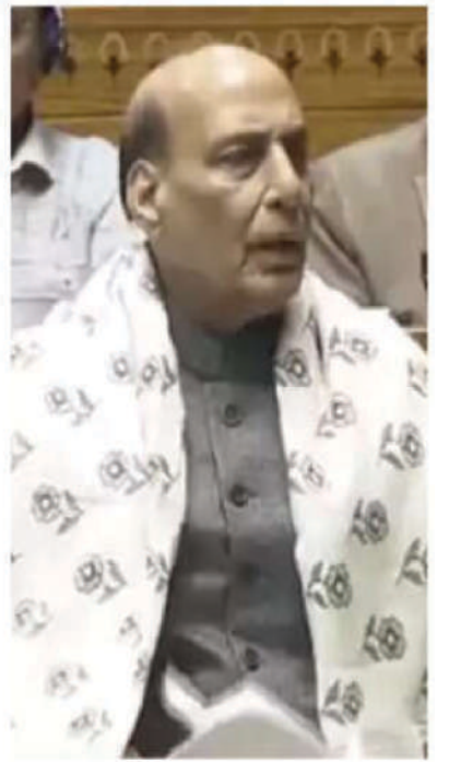
కాంగ్రెస్ పై పరోక్షంగా విమర్శలు చేశారు. ఈ ప్రకటనతో దిగువ సభలో తీవ్ర గందరగోళం ఏర్పడింది. మంత్రి వ్యాఖ్యలను వ్యతిరేకిస్తూ విపక్ష సభ్యులు తీవ్ర నిరసన వ్యక్తం చేశారు. శనివారం వరకు కొనసాగే ఈ చర్చకు ముగింపుగా ప్రధాని మోదీ సమాధానం ఇస్తారు.

నేషనల్ బ్యూరో: భారత రాజ్యాంగాన్ని ఆమోదించుకొని 75వ ఏడాదిలోకి అడుగు పెట్టిన సందర్భంగా పార్లమెంటులో ప్రత్యేక చర్చ చేపట్టారు. కేంద్ర ప్రభుత్వం తరఫున లోక్ సభలో రక్షణమంత్రి రాజ్ నాథ్ సింగ్ ఈ చర్చను ప్రారంభించారు. రాజ్యాంగ నిర్మాణానికి కృషి చేసిన కొంతమంది ప్రయత్నాలను ఉద్దేశపూర్వకంగానే విస్మరించారని మంత్రి అన్నారు. 'రాజ్యాంగ రూపకల్పనలో కీలకపాత్ర పోషించిన కొందరి పాత్ర విస్మరణకు గురైంది. స్వాతంత్ర్య ఉద్యమ పోరాట స్ఫూర్తి నుంచి ఈ రాజ్యాంగం ఉద్భవించింది' అని మంత్రి వెల్లడించారు. అప్పుడు రాజ్యాంగాన్ని రూపొందించేందుకు ఏర్పాటైన కమిటీలో భాగం కాకపోయినా ఈ ప్రక్రియలో కీలకపాత్ర పోషించారంటూ మదన్ మోహన్ మాలవీయ, లాలా లజపత్ రాయ్, భగత్ సింగ్, వీర సాహెబ్ వంటి ప్రముఖులు పేర్లను ప్రస్తావించారు. ఒక పార్టీ రాజ్యాంగాన్ని హైజాక్ చేసేందుకు ప్రయత్నించినది