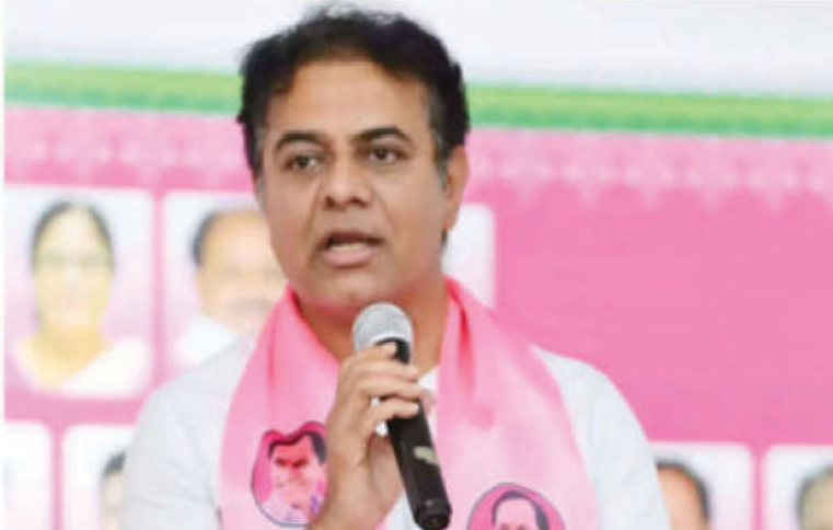
గురుకుల సమస్యలపై, విద్యార్థుల ఆత్మహత్యలు, పిల్లల మరణాలపై గతమెత్తితే గొంతు నొక్కుతారా అని ప్రశ్నించారు. మా బీఆర్ఎస్ నాయకులు గురుకుల వాట పాదుతాం అంటే అడ్డుకుంటారా అంటూ ఎక్స్ వేడికగా సైర్ అయ్యారు. అరెస్ట్ చేసిన వానికి తక్షణం విడుదల చేయాలని డిమాండ్ చేశారు.