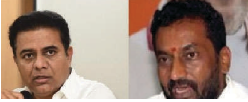
వచ్చేది కాదన్నారు. కేటీఆర్ ను సమీపాధి బాధ్యతలు అప్పగించినందుకు కేటీఆర్ ప్రస్తుతం ప్రజలకు ముఖం

పాటు ఆయన తన మెదడును కూడా కోల్పోయినట్లు ఉందని ఎద్దేవా చేశారు. అధికారంలో ఉన్న పదేళ్లలో అన్ని శాఖల్లో వేలుపెట్టి తెలంగాణ ఆర్థిక, విద్య, వైద్య వ్యవస్థలను కేటీఆర్ చిన్నాభిన్నం చేశాడని బీజేపీ ఎంపీ రఘునందన్ రావు ఆరోపించారు. రాజకీయాలు ఎలా చేయాలో కేటీఆర్ లాంటి వారి దగ్గర నేర్చుకోవాల్సిన దౌర్భాగ్యం తమకు పట్టలేదన్నారు. రాజకీయం ఎలా చేయాలో, ప్రజా సమస్యలను ఎలా పరిష్కరించాలో ఆయనకు తెలియి ఉంటే చేతిలో ఉన్న అధికారం కోల్పోయి పరిస్థితి