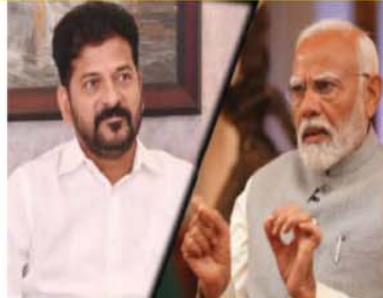
స్వస్థం. పూర్వ నీటి కోసం మార్గం పూర్తి అయింది. ఏర్పాటు చేస్తున్నాం. ప్రజలకు అన్ని ప్రతి వాగ్దానం చేస్తున్నాం. స్మిల్ చర్చిలో, సోన్స్ చర్చిలో ఏర్పాటు పై పవిత్రమైన నిబద్ధతతో ఉన్నాం. 'ఆంధ్ర రేవంత్ రెడ్డి' చేస్తున్నాం. ఇండిగో టెక్స్టైల్ రెసిస్టెన్స్ యల్ సూల్స్

రుణమాఫీ చేశారు. ఇందులో భాగంగా 25 కోట్లలోనే రూ. 18 వేల కోట్లు అమలు చేశారు. 200 యూనిట్ల వరకు ఉచిత విద్యుత్ సౌకర్యం కల్పించారు. టీడీపీ పాలిత రాష్ట్రాల్లో గ్యాస్ ధరలు అధికంగా ఉన్నాయి. తెలంగాణలో రూ. 500 కే సీఎం రేవంత్ ఇచ్చారు. ఇప్పటివరకు 43 లక్షల మందికి సీఎం రేవంత్ ధ్వారా లబ్ధి చేశారు. అధిక సంఖ్యలో ఉద్యోగ నియామకాలు చేపట్టారు. 'గ్రామ్స్' పరిశ్రమలను రెవ్యూయర్లగా నిర్వహిస్తున్నారు. 11 నెలల్లోనే 50 వేలకు పైగా ఉద్యోగ నియామకాలు చేపట్టారు. నియామకాల్లో ఏ టీడీపీ పాలిత రాష్ట్రం పోల్చినా మాదే రికార్డు. చీఫ్ మంత్రి వై.ఎస్. జగన్మోహన్ రెడ్డి, కాంగ్రెస్ లోని 40 శాతానికి పైగా మంది. మానీ పునరుద్ధరణకి సమంజసిగా ఉన్నారు. కర్షకులకు గుర్తింపు సీటి పనులను సురక్షిత