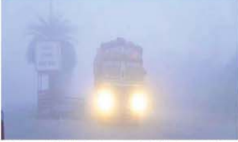
చరితో ప్రజలు వణికిపోయారు. మంచు దుప్పటి కప్పేసింది. దుండేపల్లి మండలాల్లో పొగమంచు జిల్లాలో పొగమంచు భారీగా కురిసింది. జిల్లాలోని అలసమకుంది.

తెలంగాణ బ్యూరో : నిజామాబాద్ జిల్లాలో దట్టమైన పొగమంచు కమ్ముకుంది. శనివారం వేకువ జామున భారీగా పొగ మంచు కురవడంతో రాకపోకలకు తీవ్ర అంతరాయం ఏర్పడింది. ఇందూరు పట్టణంలో కనుచూపుమేరలో పొగమంచు నెలకొంది. మంచు వెళ్తున్న వాహనాలు కనిపించకపోవడంతో వాహనదారులు ఇబ్బంది పడ్డారు. దీంతో లైట్లు వేసుకొని వెళ్లారు.