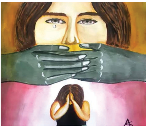
చేతిలో హత్యాచారానికి గురై తీవ్ర గాయాలతో ప్రాణాపాయ స్థితిలో వుంది. మనుషుల రూపంలో వున్న రాక్షసుల చేతిలో పసిపాపల ప్రాణాలు పోతున్నా కుత్బుల్లాపూర్ ప్రజల్లో మాత్రం

స్పందించి కొవ్వొత్తుల ర్యాల్లీలు తీసి సామూహిక మాధ్యమాలలో స్టేట్స్ లుగా పెట్టుకునే ప్రజలు తమ ఇంట్ల మధ్యన అభివృద్ధి తెలియని చిన్నారులు కామాంధుల కర్కష చేతుల్లో నలిగిపోతూ ప్రాణాపాయ స్థితిలో కొట్టుమిట్టాడుతుంటే ఆ విషయమే తమకు పట్టనట్టుగా వ్యవహరిస్తున్నారు. ఇటీవల సూరారం ప్రాంతానికి చెందిన ఓ బాలిక ఉన్నాది చేతిలో దారుణ హత్యకు గురైన సంఘటన మరువకముందే బౌరంపేట్ లో ముక్కు పచ్చలారని ఓ పసిపాప కామాంధుడి